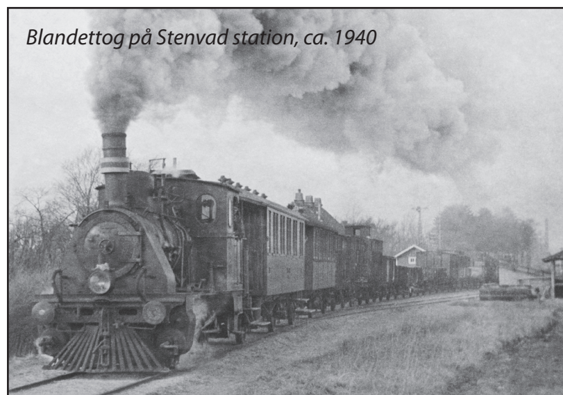
Blandetog på Stenvad station, ca. 1940

Banens godstrafik gav nye muligheder, og flere byer skylder Gjerrildbanen deres eksistens. Gravning af tørv ved Stenvad skabte industri og en by ved stationen. Tømmer fra de store skove ved Meilgaard Gods og Sostrup blev sendt med banen, og et savværk blev etableret i Tranehuse. Kystfiskerne ved Fjellerup og Bønnerup sendte fisk helt til Nordtyskland. Landmænd modtog foderstoffer og gødning, mens dyr blev sendt til slagteriet. Fra engene nær Glæsborg station blev der hentet mergel til landmænd. Fra Gjerrild Nordstrand blev der under Besættelsen